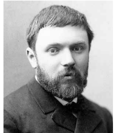
Henri Poincaré (1854-1912)

La loi d'addition des vitesses est encore très acceptable, à 1 % près.