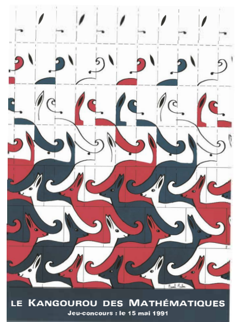
La première affiche du jeu-concours Kangourou, avec le logo paveur inventé par Raoul Raba, sculpteur, prix de Rome 1955.

Le premier jeu-concours Kangourou a lieu le 15 mai 1991. Ayant été immédiatement couronné de succès, peu de temps après, ils en répandent l'idée en Europe.