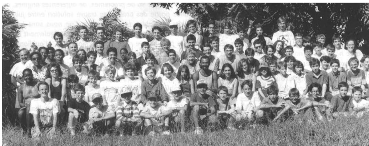
Le groupe des lauréats du Kangourou des mathématiques 1993 en Guyane à la Toussaint.